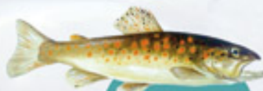
Truite corse macrostigma

Attention, les poissons ne sont pas les seules espèces concernées par les introductions sauvages. On constate également que des populations de tortues de Floride et d'écrevisses américaines se propagent considérablement et viennent perturber le fonctionnement de l'écosystème. Ces espèces se développent au détriment d'espèces locales et peuvent induire de graves modifications écologiques sur le milieu.